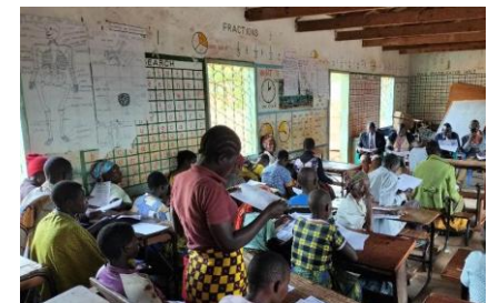
父母リーダーによる学習会—学校関係者と一般保護者が参加