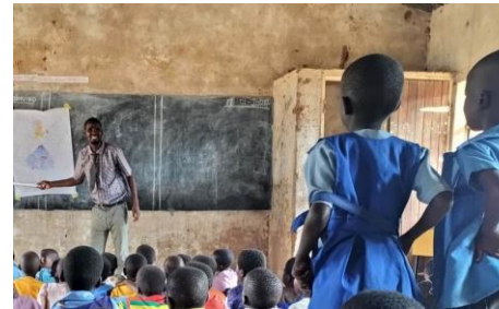
初等学校でライフスキル教育の授業を観察