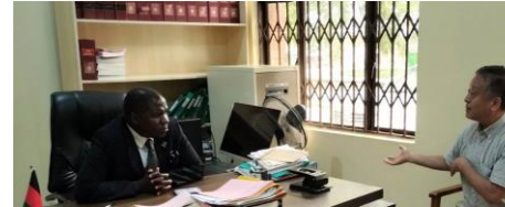
パロンベ県知事と事業について確認