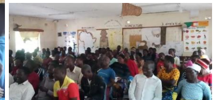
父母リーダー研修