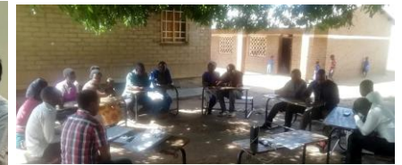
各校で父母リーダーの参加の意思を確認