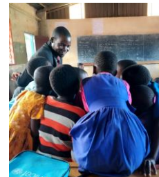
授業で行なわれているグループ学習の様子