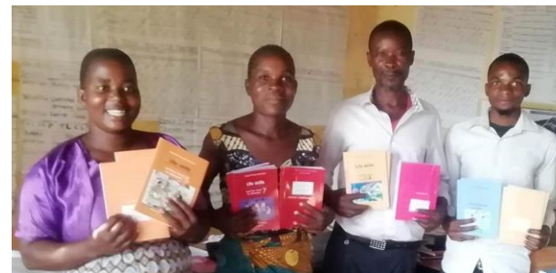
ライフスキル教科書を供与