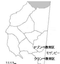
ナゾンベ教育区とクランベ教育区から開始